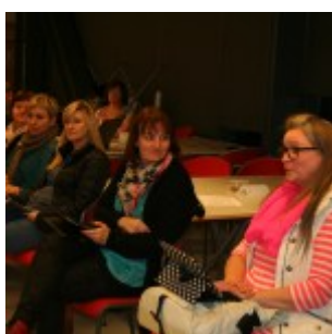
Umræður í lokin.