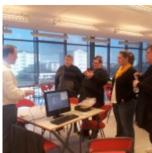
Menntabúðir 10. apríl 2014

Myndirnar hérna fyrir neðan eru samansafn af menntabúðum skólaárið 2013-2014.