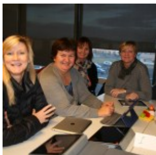
Skapandi smáforrit í ipad.