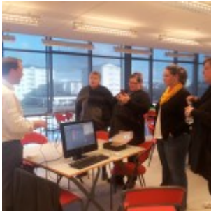
Menntabúðir 10. apríl 2014

Myndirnar hérna fyrir neðan eru samansafn af menntabúðum skólaárið 2013-2014.