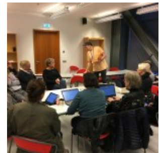
Menntabúðir – Forritun – 27.10.16