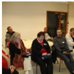
Umræður í lokin.