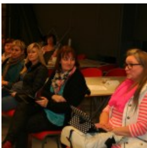
Umræður í lokin.