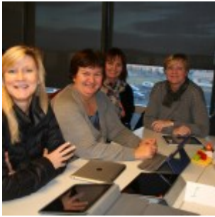
Skapandi smáforrit í ipad.