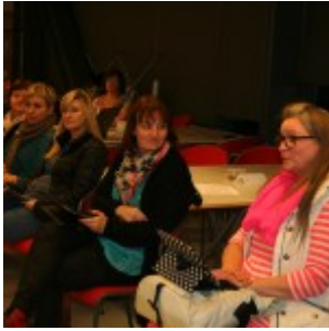
Umræður í lokin.