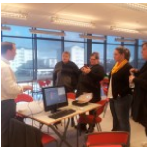
Menntabúðir 10. apríl 2014

Myndirnar hérna fyrir neðan eru samansafn af menntabúðum skólaárið 2013-2014.