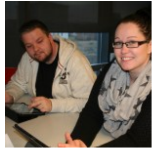
Google forrit í kennslu.