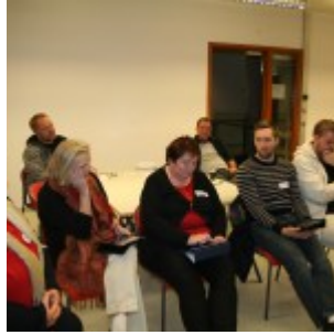
Umræður í lokin.