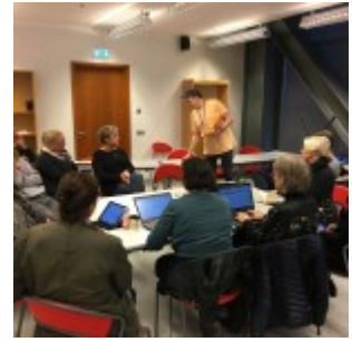
Menntabúðir – Forritun – 27.10.16