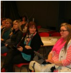
Umræður í lokin.