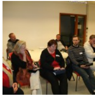
Umræður í lokin.